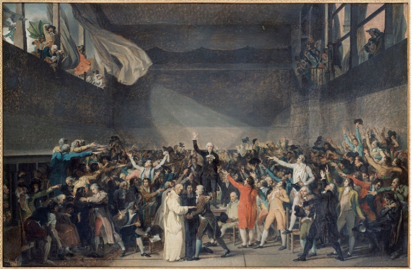
Le Serment du Jeu de Paume, David